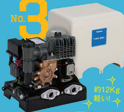
浅井戸用圧力タンク式 定圧ポンプ THP-6

PG-Aと同じ水量を満たすポンプながら本体重量が約12Kgと軽い ため、おひとりでも施工できます。 コンパクトサイズでシンプルな 構造で、修理がしやすく部品コスト を抑えられます。