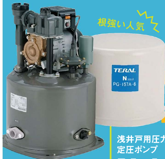
浅井戸用圧力タンク式 定圧ポンプ PG-A

シンプルな構造で、故障時の修理がしやすいため、昔から人気の商品です。水道が通っていないご家庭の生活用水や、庭・畑の散水用などにご利用いただいています。