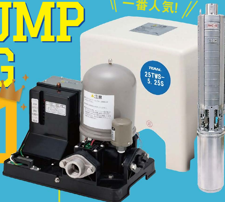
深井戸用 水中ポンプ TWS

当社1番人気は、自然水位が低い地域や融雪用として大好評のTWS! お客様のお声により、正常・故障がランプの色でわかるようにしました。おかげさまで設置業者様からも大変ご好評をいただいています。