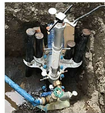
狭いスペースでも施工可能