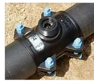
管路に残るものはサドルのみ