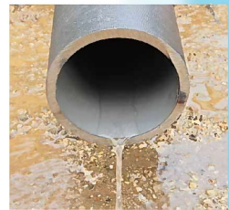
配管工事に支障のない止水性