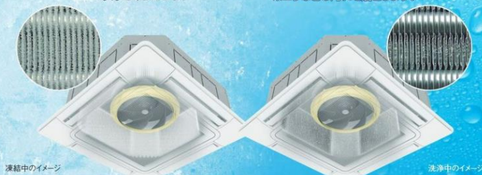
凍結中のイメージ